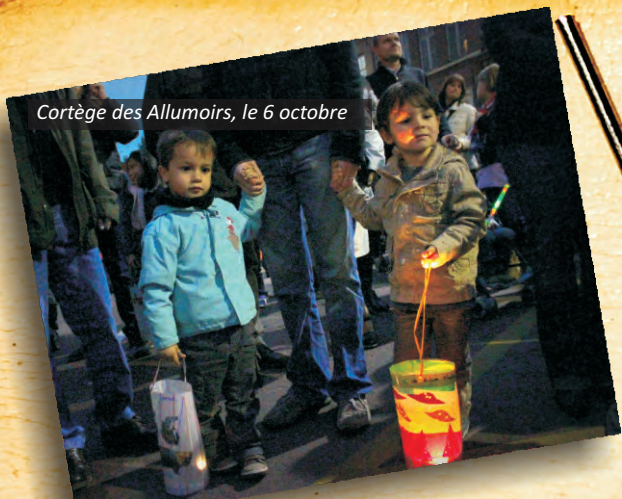
Cortège des Allumoirs, le 6 octobre