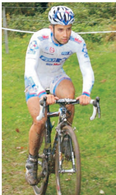
Le champion de France professionnel sur route 2012 Nacer Bouhanni a participé à la course Elite.

Les 20 et 21 octobre derniers, les villes de Wambrechies et Marquette se sont associées à l'Espoir Cycliste pour organiser une grande fête du vélo baptisée... Faites du vélo ! Tout un programme dont l'objectif était de démocratiser l'usage de la petite reine mais qui a également mis en valeur un lieu magique pour le cyclo-cross : le fort du Vert Galant.