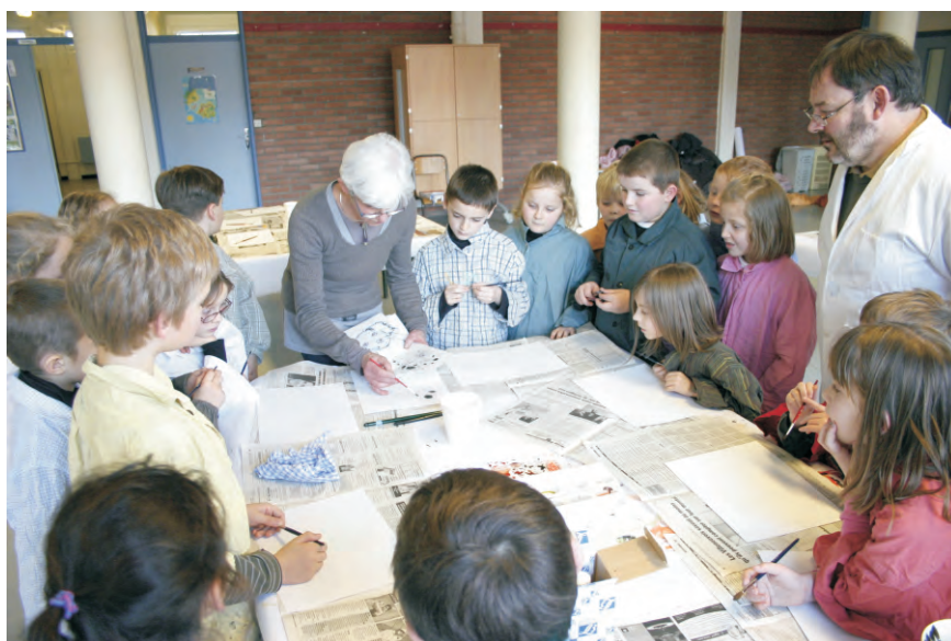
Les écoliers de l'école élémentaire Jules Ferry (ici en 2010 lors d'un atelier artistique) sont toujours aussi nombreux : 275 en 2010/2011 !