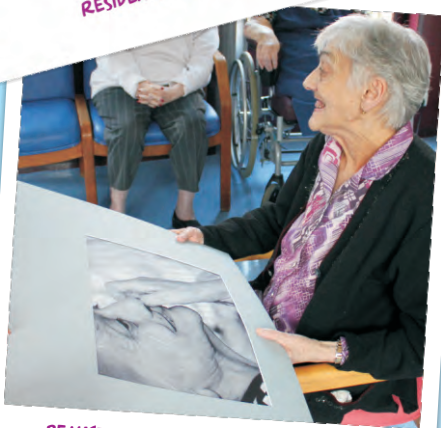
REMISE DES PHOTOS AUX AÎNÉS AYANT PARTICIPÉ À L'EXPOSITION : «PORTRAITS DE SAVOIR FAIRE»