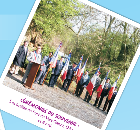
CÉRÉMONIES DU SOUVENIR : Les fusillés du Fort du Vert Galant, Déportation et 8 mai.