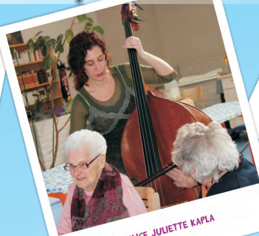
RÉSIDENCE JULIETTE KAPLA