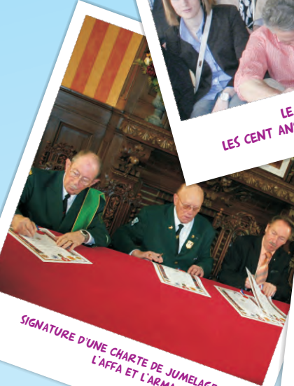
SIGNATURE D'UNE CHARTE DE JUMELAGE ENTRE L'AFFA ET L'ARMA. 13 MARS 2011