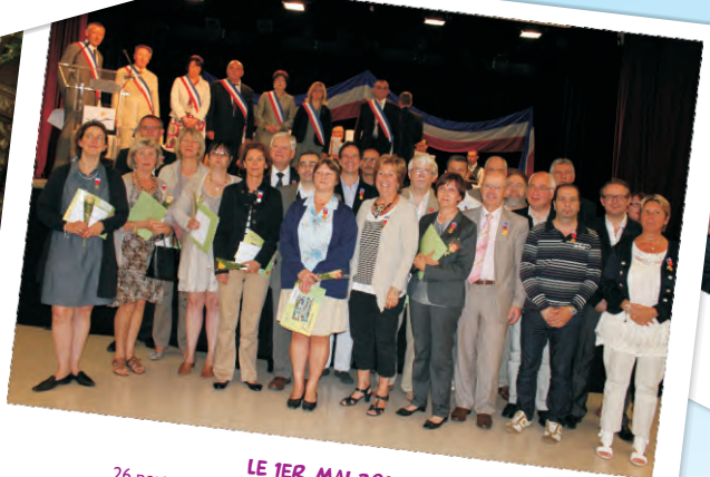
LE 1ER MAI 2011 26 personnes ont été décorées de la médaille du travail.