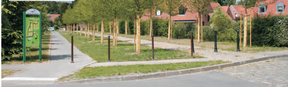
Pour des raisons de sécurité, les arbres ont dû être abattus cet hiver (photo en haut à gauche). Des charmes ont été replantés et un éclairage à faible consommation balise maintenant la drève.