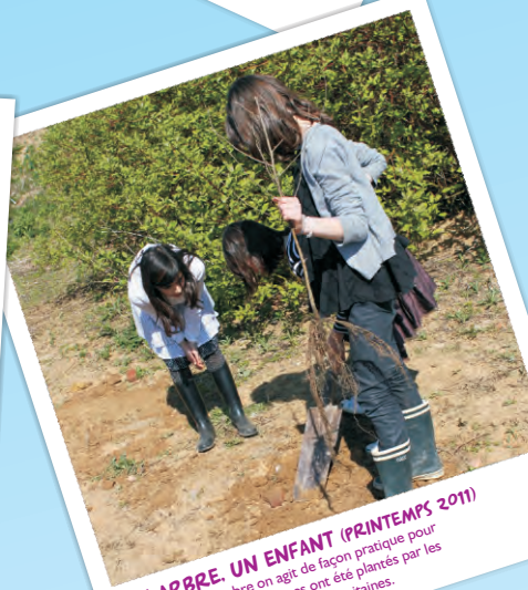
UN ARBRE. UN ENFANT (PRINTEMPS 2011) En plantant un arbre on agit de façon pratique pour l'environnement. 500 arbres ont été plantés par les enfants des quatre écoles wambrechitaines.