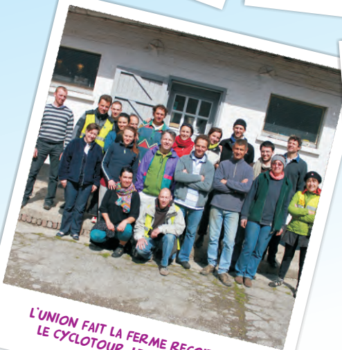
L'UNION FAIT LA FERME RECOIT LE CYCLOTOUR. LE 12 AVRIL