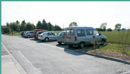
Un nouveau parking public de 12 places a été bâti chemin du Bihamel