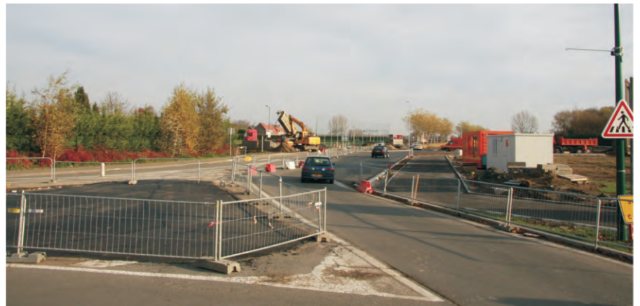
Photo du bas, prise le 19 novembre dernier : tribulations d'un chantier... Les travaux avancent sans (trop) perturber la circulation.