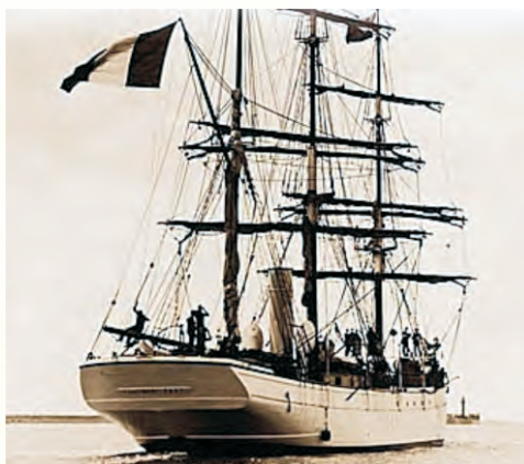
Le Pourquoi Pas ?, avec lequel il sombra en 1936

Cela a suffi et suffira jusqu'au bout. »