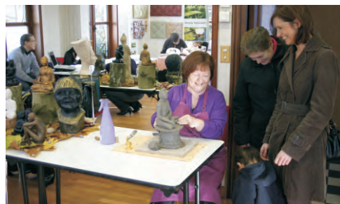
Ambiance bon enfant et sourires au programme : c'est aussi cela, les artistes de l'ombre.