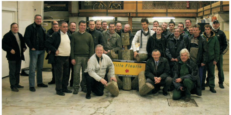
L'équipe des services techniques (au quasi-complet), en compagnie des élus, réunie autour du panneau symbolisant l'obtention de la première fleur. La récompense d'un travail de longue haleine, débuté voici maintenant neuf ans.