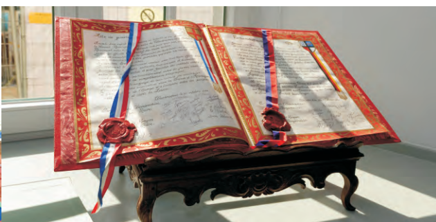
Volker Rübo (à gauche), le maire de Kempen, serrant la main de Daniel Janssens le 15 septembre dernier à Kempen, lors de la célébration des 40 ans de jumelage entre les deux villes. À droite, l'acte de jumelage signé le 1er septembre 1972.