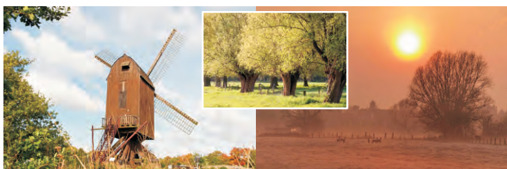
Juché sur une ancienne moraine glaciaire au Nord de la ville, le vieux moulin de Tönisberg veille sur une campagne romantique à souhait.