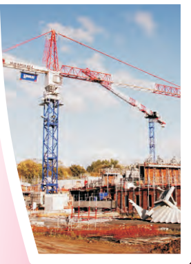
Rue d'Ypres, quartier Est : le point sur les travaux > pages 4 & 5