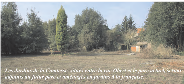
Les Jardins de la Comtesse, situés entre la rue Obert et le parc actuel, seront adjoints au futur parc et aménagés en jardins à la française.

Les travaux de réaménagement du parc municipal, largement contraints par l'âge centenaire de ses nombreux peupliers, ont débuté à la fin de l'été. Plusieurs arbres ont été abattus, laissant par endroits le sol à nu. Rassurez-vous, ce lieu très apprécié sera replanté afin de le rendre encore plus convivial, et agrandi.