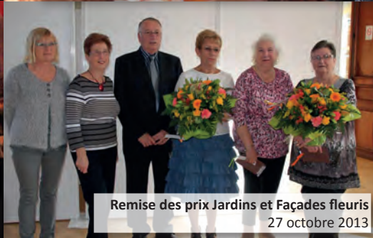
Remise des prix Jardins et Façades fleuris 27 octobre 2013