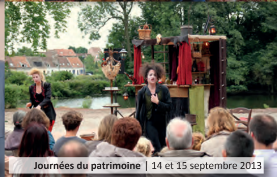
Journées du patrimoine | 14 et 15 septembre 2013