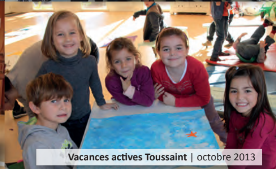
Vacances actives Toussaint | octobre 2013