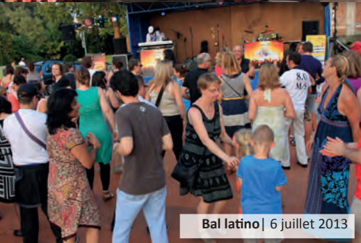
Bal latino | 6 juillet 2013