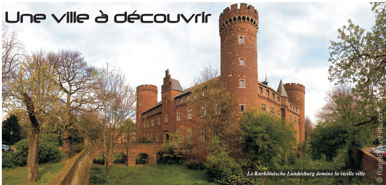
Le Kurkölnische Landesburg domine la vieille ville

Kempen la médiévale, 36 000 habitants, est située dans l'ouest de la Rhénanie-du-Nord-Westphalie, à la frontière des Pays-Bas. Considérée comme l'une des plus belles villes du Bas-Rhin, elle n'est qu'à trois petites heures de route de Wambrechies... De là à vous suggérer l'idée d'un week-end original, il n'y a qu'un pas vite franchi.