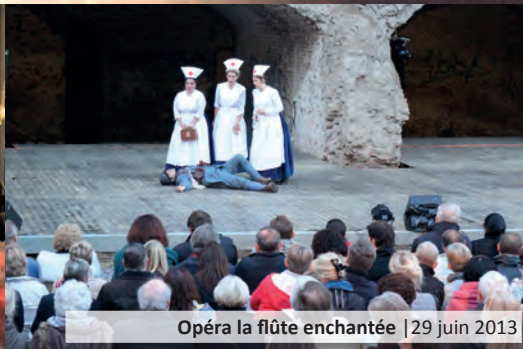
Opéra la flûte enchantée | 29 juin 2013