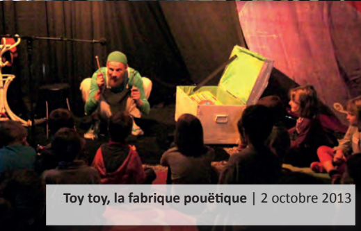
Toy toy, la fabrique pouëtique | 2 octobre 2013