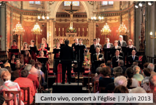
Canto vivo, concert à l'église | 7 juin 2013