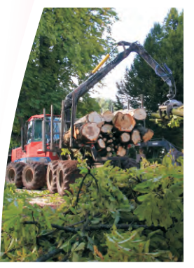
Réaménagement du parc de Robersart : c'est parti ! > page 3