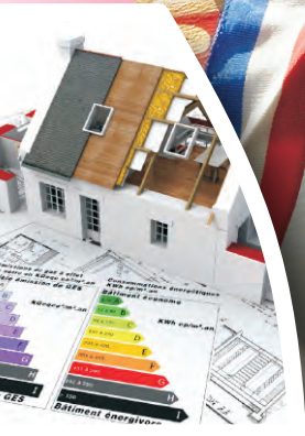
Amélioration de l'habitat : la Ville peut vous aider > page 6