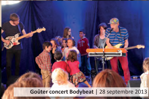
Goûter concert Bodybeat | 28 septembre 2013