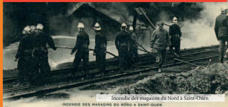
Incendie des magasins du Nord à Saint-Ouen