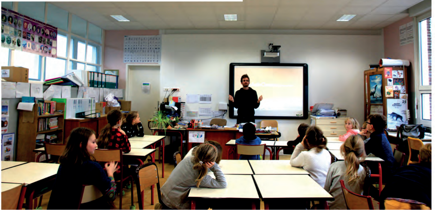
Un mardi après-midi, pendant l'atelier NAP photographie