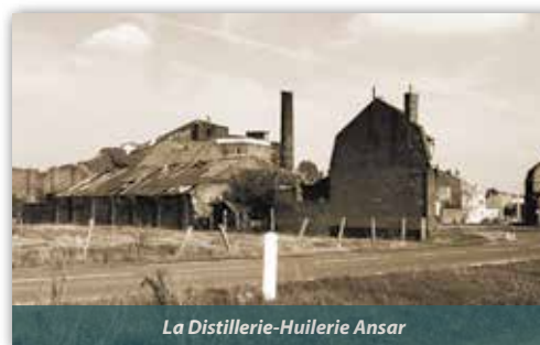
La Distillerie-Huilerie Ansar

La distillerie et l'huilerie constituent l'autre grande activité « industrielle » de Quesnoy-sur-Deûle. Le principal établissement est situé rue d'Ypres, à proximité de la Deûle, ce qui facilite à la fois l'approvisionnement en matières premières et l'expédition des produits finis. D'abord connu sous le nom d'Établissement Fretin, Ghestem et Vandermersch, du nom de ses fondateurs, elle change de raison sociale pour devenir la distillerie-huilerie Ansar.