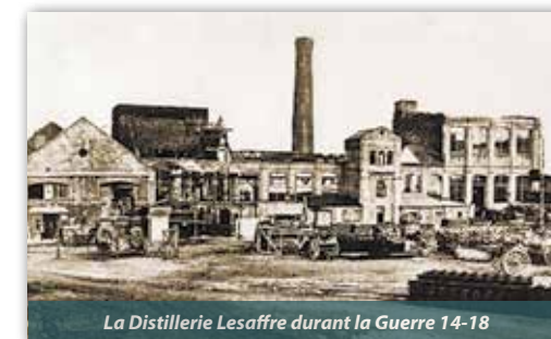
La Distillerie Lesaffre durant la Guerre 14-18

La distillerie Lesaffre œuvre dans le secteur de l'épuration de vinasses et de la récupération de leur azote. En raison même de son activité, elle se trouve soumise à autorisation au titre d'établissement dangereux et insalubre.