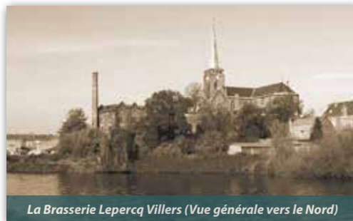
La Brasserie Lepercq Villers (Vue générale vers le Nord)

La brasserie Lepercq Villers s'installe en 1892 au 2 rue Pasteur dans les locaux d'une ferme. Son activité consiste à broyer les grains de céréales, qui viennent pour partie de Flandre, pour ensuite les mélanger à de l'eau et accompagner la fermentation. Les locaux se composent d'une salle de séchage pour les cônes de houblons et de pièces abritant les différentes machines nécessaires à la fabrication : concasseurs, chaudières, cuves à fermentation... De taille modeste, elle emploie 2 à 5 ouvriers, à l'image de la plupart des brasseries de la région.