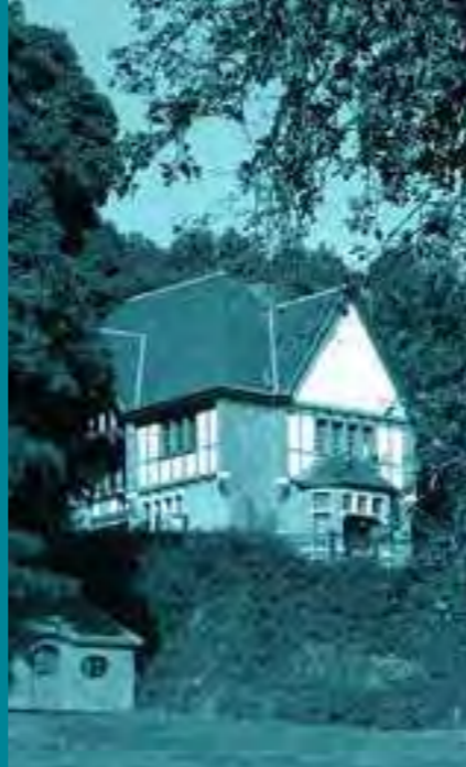
LA VILLA DÉPARTEMENTALE MARGUERITE YOURCENAR

La participation à ce concours implique l'acceptation complète de ce règlement. Le règlement peut être obtenu sur simple demande.