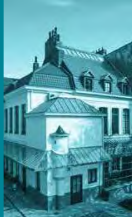
LA MAISON NATALE CHARLES DE GAULLE

La Maison natale Charles de Gaulle est un équipement culturel du Département du Nord. Le musée propose de découvrir la jeunesse et l'éducation de Charles de Gaulle.