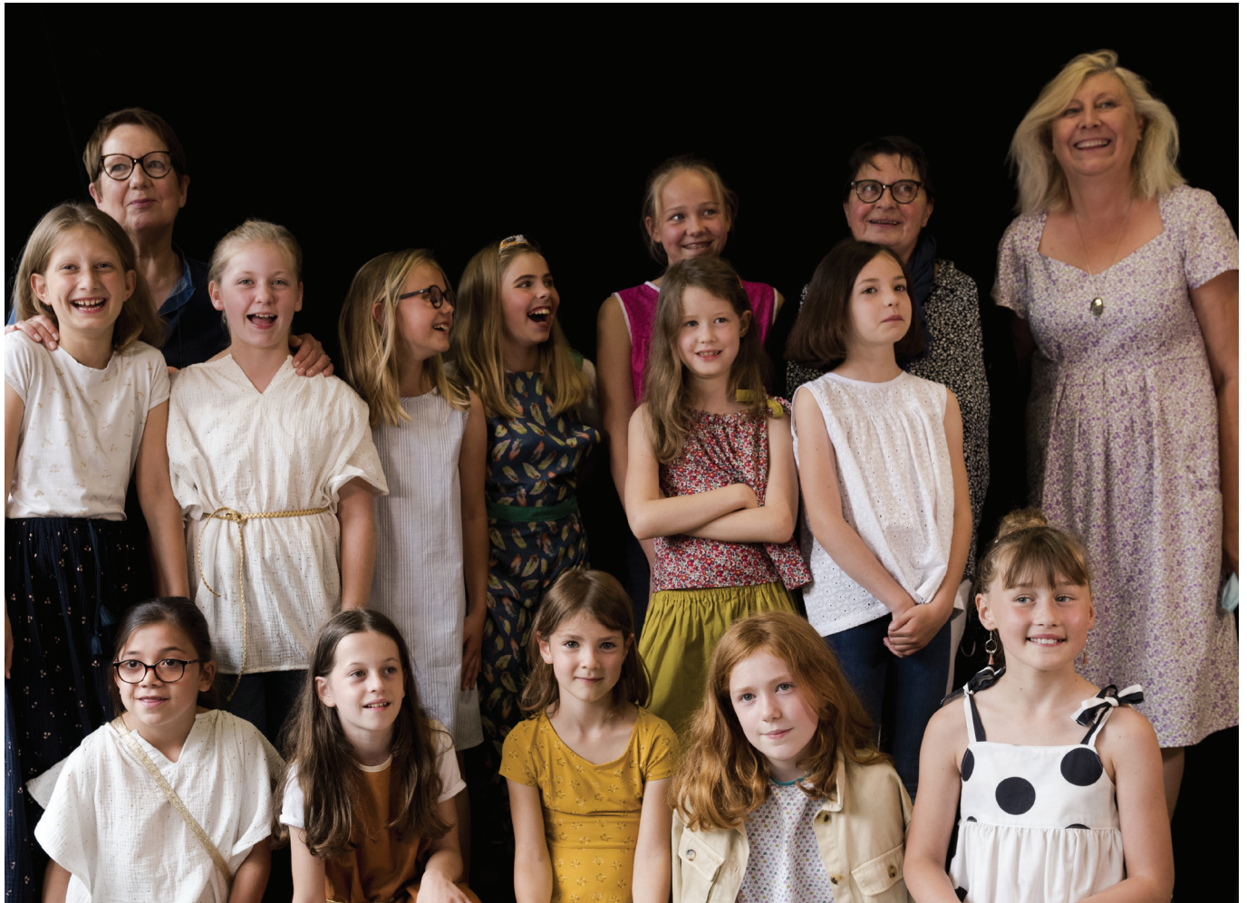
© Thierry DESCAMPS - Wambrechies défilé école de couture 2021 - Photo-club Wambrechitain.

Vendredi 29 : Conférence Soirée au Château , 20h, Château de Robersart.