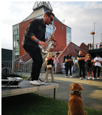
© Veronique HOOREMAN - Animations sur le Port.

psychothérapeute spécialisée en Analyse Transactionnelle et en thérapie énergétique (Access Bar). Technique permettant d'accélérer l'élimination des mémoires, croyances et émotions liées aux différents traumatismes passés ou récents. Accompagnement et soutien psychologique adultes, adolescents et enfants. Aide à la parentalité | 2155 rue de Quesnoy 06.60.05.33.41 | sur rendez-vous delgrange.christine@gmail.com psychologue-lille.fr