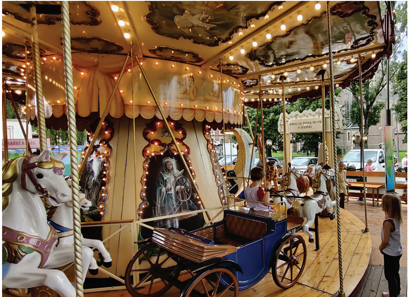
Le Carousel.

Dates des manifestations sous réserve de modification des prestataires et des conditions sanitaires.