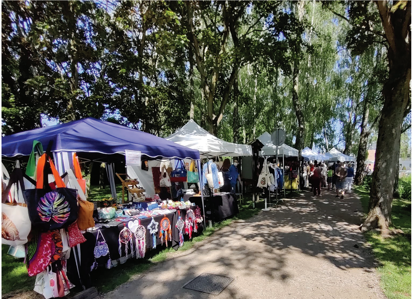
© Robin WALLART - Marché artisanal.

Dates des manifestations sous réserve de modification des prestataires et des conditions sanitaires.