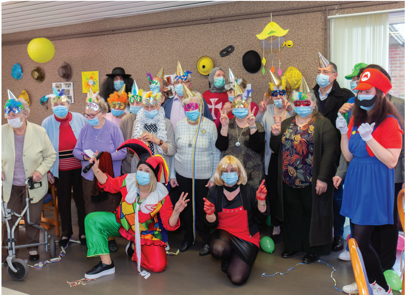
© Cédric BOERAEVE - Petit paradis - Photo-club Wambrechain.

Dates des manifestations sous réserve de modifica- tion des prestataires et des conditions sanitaires.