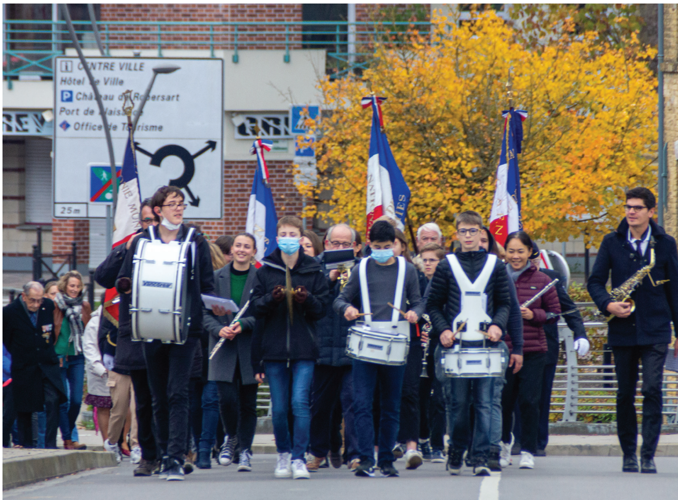
© Cédric BOERAEVE - 11 novembre 2021 - Photo-club Wambrecitain.

Dates des manifestations sous réserve de modification des prestataires et des conditions sanitaires.