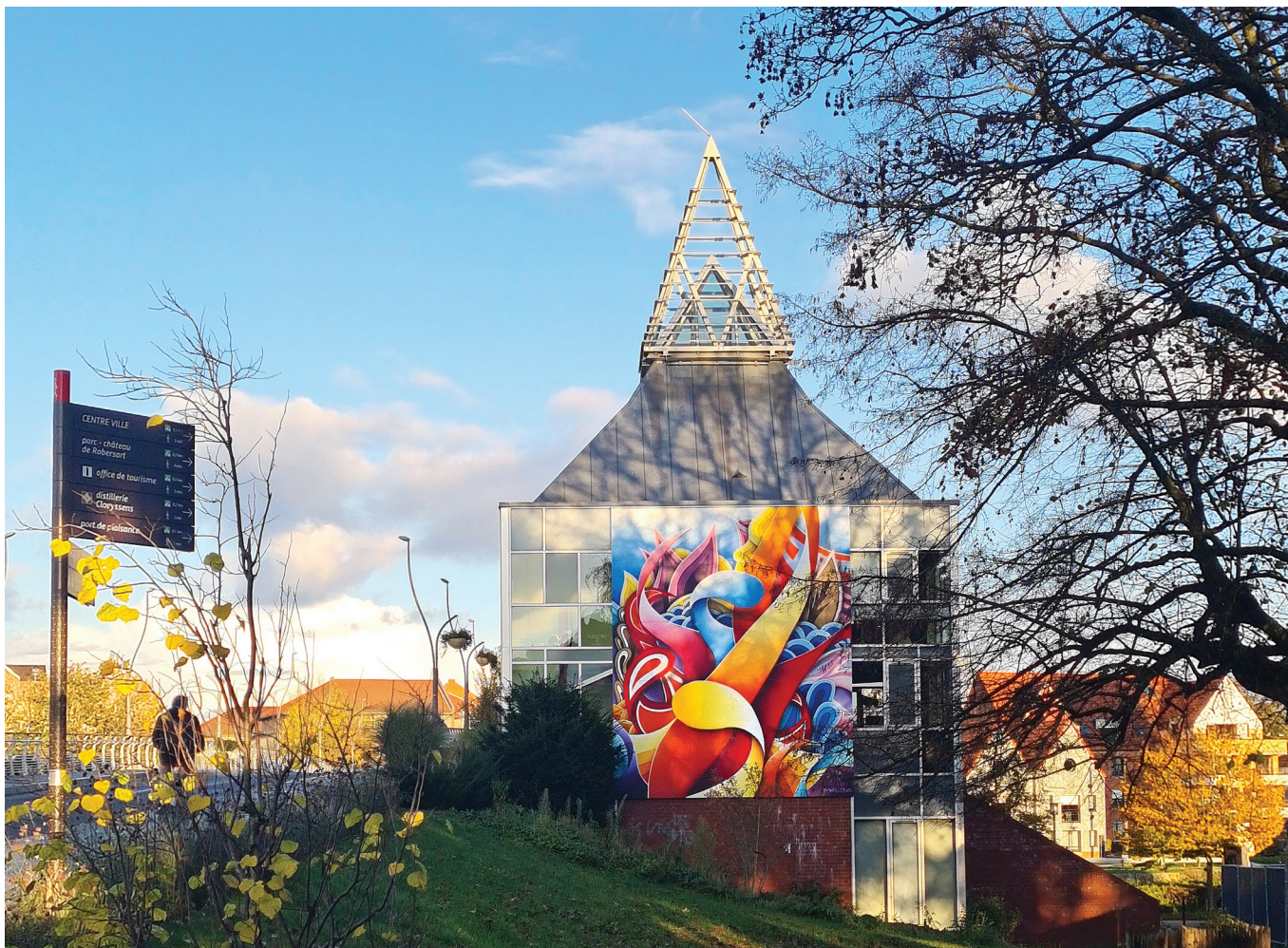
© Amaury DUBOIS - Fresque d'Amaury DUBOIS Wambrechies.

Dates des manifestations sous réserve de modification des prestataires et des conditions sanitaires.