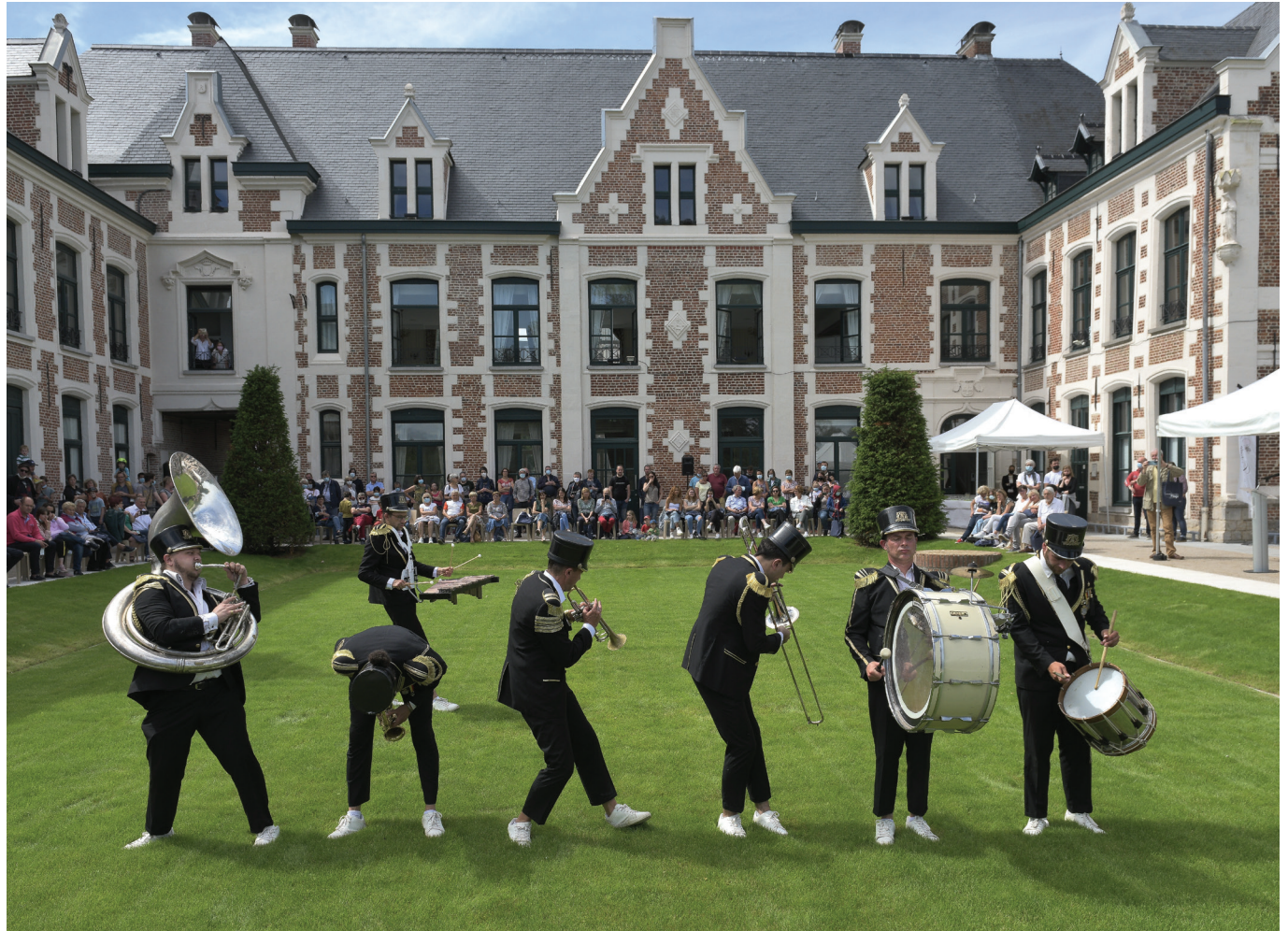
© Thierry DESCAMPS - Wambrechies Plage - Photo-club Wambrechain.

Samedi 25 : Marché nocturne au Parc, de 17h à 22h, Parc de Robersart.