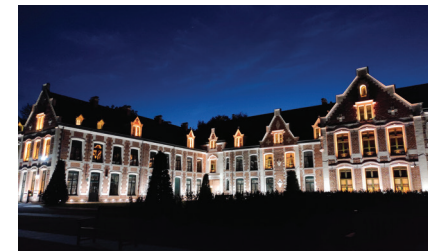
© Serge JOUAN - Septembre en Or.

Centre Local d'Information et de Coordination (réseau d'accompagnement au service des personnes âgées et de leur entourage) Contact : 2 rue de Wormhout 59520 Marquette-lez-Lille | 03.20.51.60.83 marquette@clicrelaisautonomie-cdm.fr