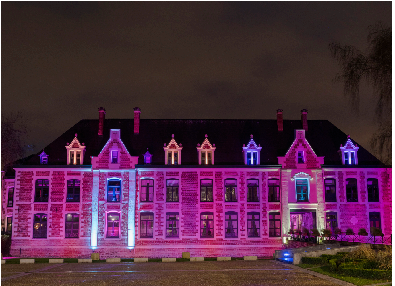
© Thierry DESCAMPS - Château de Robersart | Octobre rose - Photo-club Wambrecitain.

Dates des manifestations sous réserve de modification des prestataires et des conditions sanitaires.