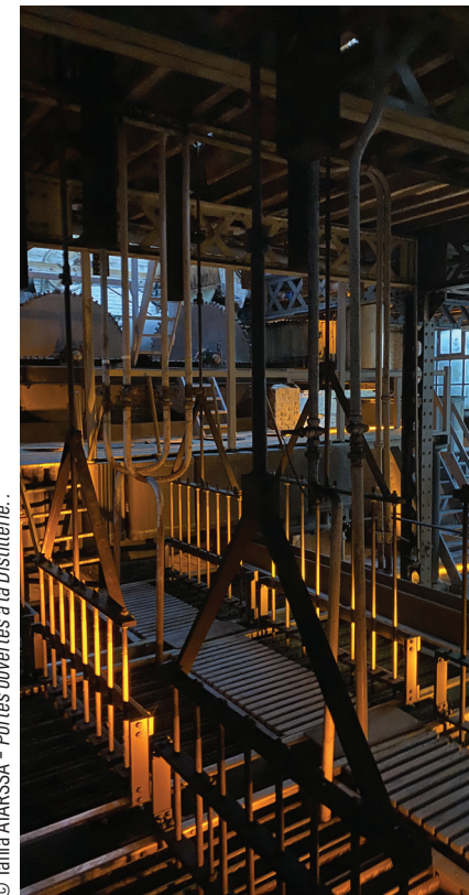
Portes ouvertes à la Distillerie.

94, rue de Quesnoy | 03.20.78.80.75 | tous les jours de 10h à 12h, de 14h à 15h et de 17h à 19h (fermé jeudi après-midi), samedi de 10h à 14h et sur rendez-vous. Visites à domicile