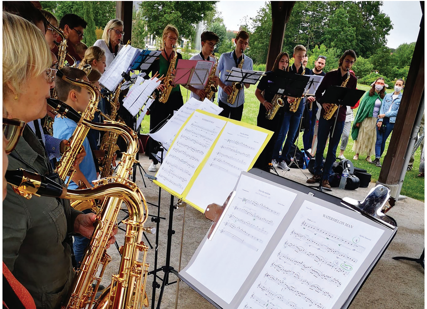
© Véronique HOOREMAN - Fête de l'Ecole de musique 2021.

Dates des manifestations sous réserve de modification des prestataires et des conditions sanitaires.