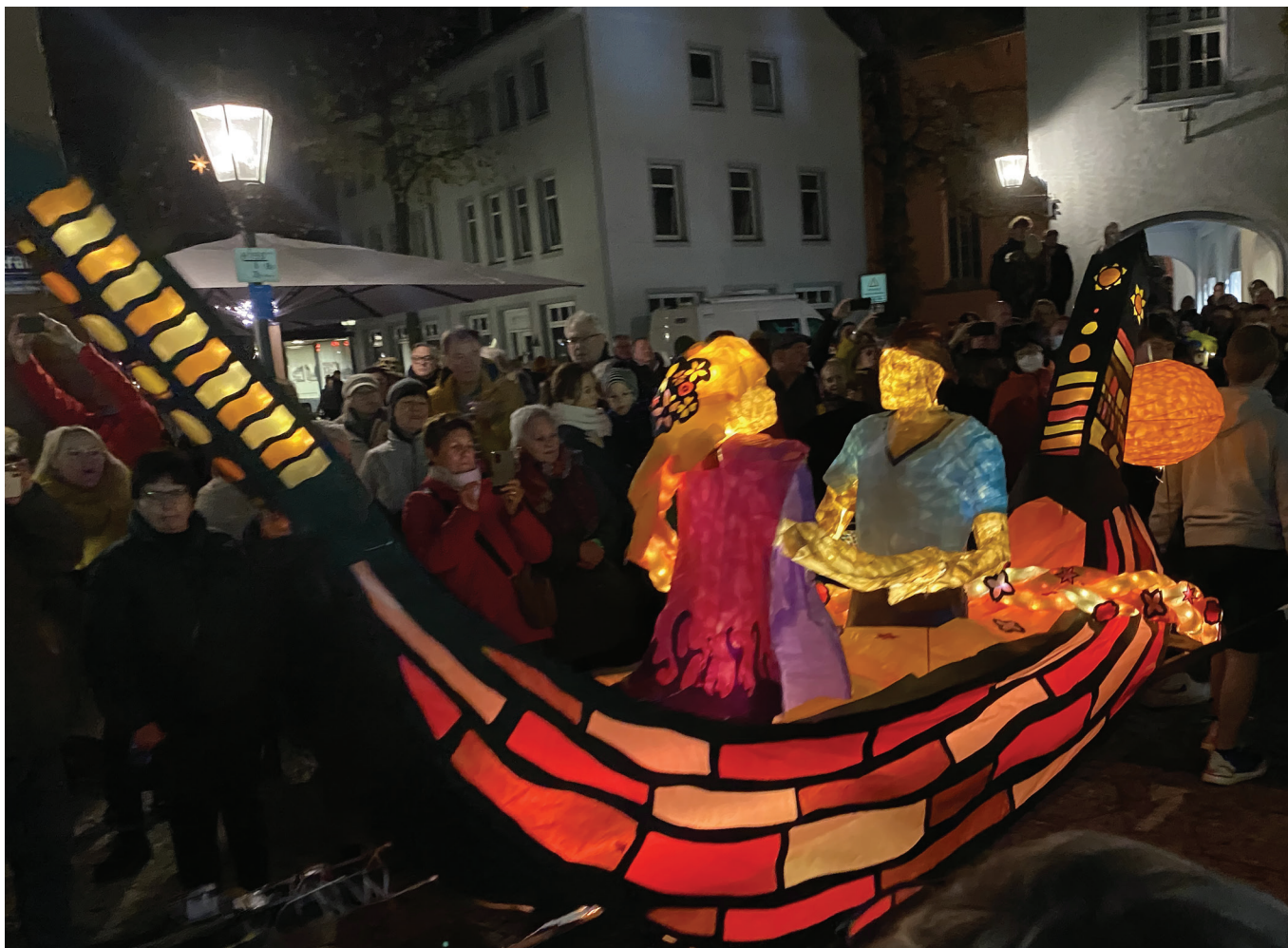
© Sébastien BROGNIART - Saint Martin à Kempen 2021.

Du lundi 19 au vendredi 23 : Accueils de Loisirs Noël, Château Rouge.