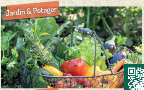
Jardin & Potager