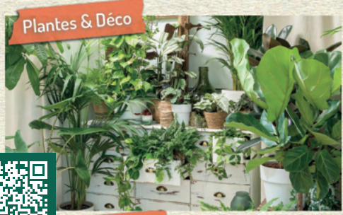
Plantes & Déco